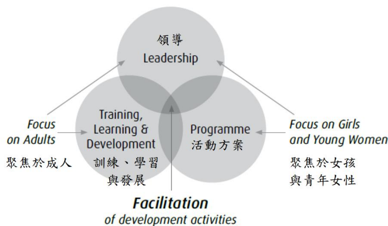
圖 2 教育性進程活動方案、成人訓練學習與發展以及領導間關係

在指引中強調，訓練員/引導員的角色已由直接傳遞內容，轉變為去引導與支持學習歷程。學習的責任已由訓練員/引導員的完全主導，轉為與學習者的共同合作，強調以學習者為中心的方式，透過引導體驗反思的經驗循環來學習。世界女童軍總會已由「提供訓練」，改變成「與學習者共同創造一個以學習者為中心的學習環境」來回應這樣的轉變。這也反應在名稱的變化上，1998年版所使用的「世界女童軍總會訓練制度」(WAGGGS Training Scheme)已不再適用，各會員組織需重新檢討重新申請認證(WAGGGS, 2012)。